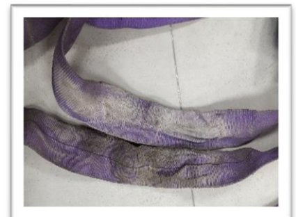
Abrasión y/o desgaste