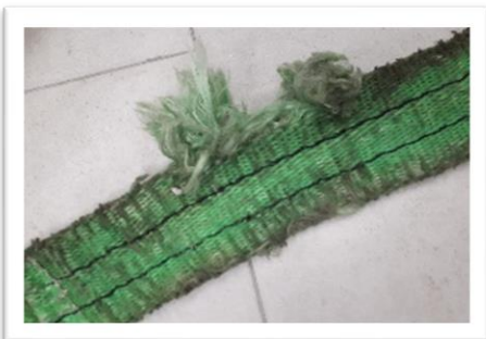
Cortes y/o rasgones