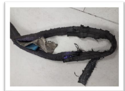
Rotura en gazas